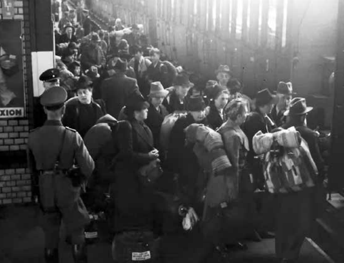
Deportation am Bahnhof Eisenach Am 9. Mai 1942, einem Samstag, mussten in Eisenach 58 Bürgerinnen und Bürger im Alter von 6 bis 63 Jahren den gewöhnlichen Personenzug 11:06 Uhr nach Weimar besteigen. Sie hatten wenige Tage zuvor einen Deportationsbefehl erhalten, weil sie jüdischen Glaubens oder jüdischer Herkunft waren. Niemand überlebte. Links im Bild ein Vertreter der Polizei, dahinter ein Eisenbahner.