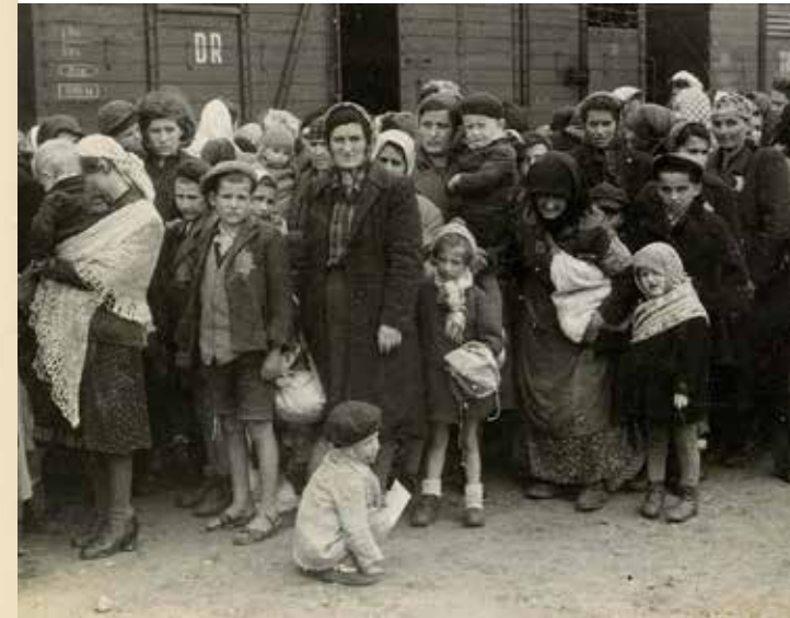
Ankunft ungarischer Juden in Birkenau In nur acht Wochen, vom 15. Mai bis 9. Juli 1944, wurden 438 000 Jüdinnen und Juden aus Ungarn in das Vernichtungslager Auschwitz-Birkenau deportiert. Fast alle wurden sofort nach ihrer Ankunft mit Gas ermordet und in den Öfen von Topf & Söhne oder - weil die Kapazität der Öfen nicht ausreichte - in offenen Gruben verbrannt. Die nach ihrem Ausstieg an der Rampe von der SS am 27. Mai 1944 fotografierten Menschen haben eine mehrtägige Fahrt ohne Essen und Trinken in Güterwaggons der Deutschen Reichsbahn hinter sich.