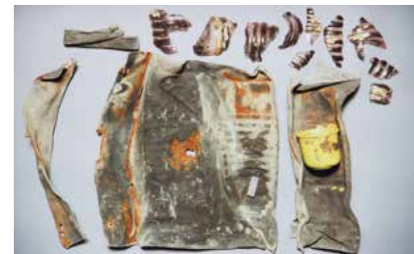
In dieser Thermosflasche versteckte der jüdische Häftling Marcel Nadjari (1917–1971) beim Krematorium III in Auschwitz-Birkenau eine Botschaft, die erst 1980 gefunden wurde.

zigen Häftlingsaufstand in Auschwitz berichtet. Ständig mit der monströsen Dimension des Mordens im Vernichtungslager konfrontiert, zur Täuschung der Opfer und zur Ausbeutung und Verbrennung ihrer Körper gezwungen, als letzte Überlebende ihrer umgebrachten Familien, und selbst permanent mit der Ermordung bedroht, ergaben sich viele Männer des jüdischen Sonderkommandos der Ausweglosigkeit ihrer Lage. Auch wenn dies die kaum vorhandenen Überlebenschancen weiter minderte, bewahrte eine kleine Gruppe in diesem Kommando, oft früher politische Aktivistinnen, ihren Kampfgeist und Willen zum Widerstand.