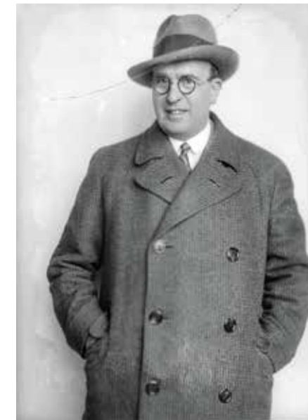
Fritz Löhner-Beda (1883–1942), österreichischer Librettist, Schlagertexter und Schriftsteller

Mitglieder des Förderkreises Erinnerungsort Topf & Söhne e.V. haben freien Eintritt.